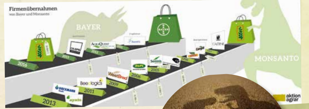
Grafik: Luisa Möbus www.vaeljudesign.de

Auf dem Kassenband der letzten Jahre: Saatgutunternehmen, Gentechniklabore, Hybrid-Spezialisten