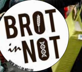
AKTIVE DER „BROT IN NOT“-KAMPAGNE VERTEILEN AKTIONSHEFTE AUF DER WIR-HABEN-ES-SATT-DEMO IM JANUAR 2017