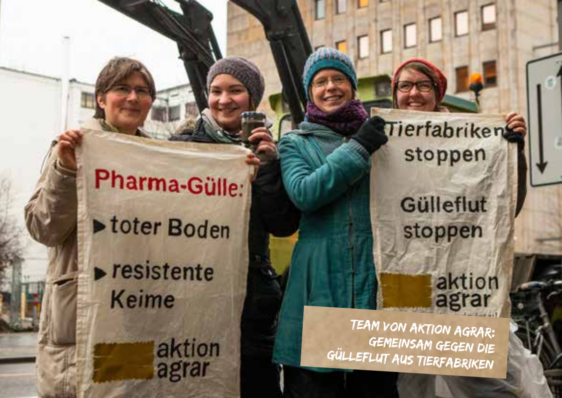
TEAM VON AKTION AGRAR: GEMEINSAM GEGEN DIE GÜLLEFLUT AUS TIERFABRIKEN